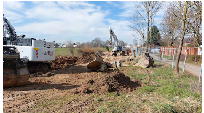
Die aktuelle Baustelle im Bereich 'Am Entenpfuhl' in Esch.