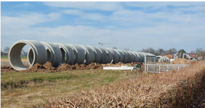
Durch diese großen Rohre fließen nach Abschluss der Arbeiten die Abwässer von Pesch zum Pumpwerk nach Esch.

Wir haben bereits mehrfach darüber berichtet: Das alte Druckrohr, welches das Abwasser von Pesch zum Pumpwerk nach Esch führt, wird durch einen "Spiegelkanal" (großes Kanalrohr mit natürlichem Gefälle) ersetzt. Die Arbeiten sind bereits weit fortgeschritten; mit dem Anschluss an das Rückhaltebecken in Pesch verschwindet dann auch der oft unangenehme Abwassergeruch auf dem Gelände des FC Pesch. Aktuell werden wieder die großen Rohre durch Pesch zur Baustelle transportiert.